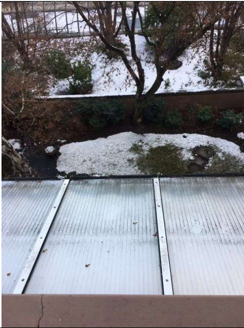
Vordach vom Balkon im 3. OG