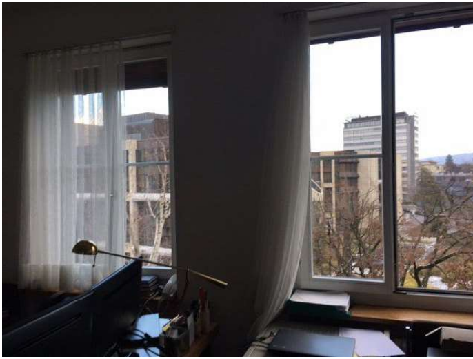
Fensterfront vom Büro von Fr. B i im 4. OG